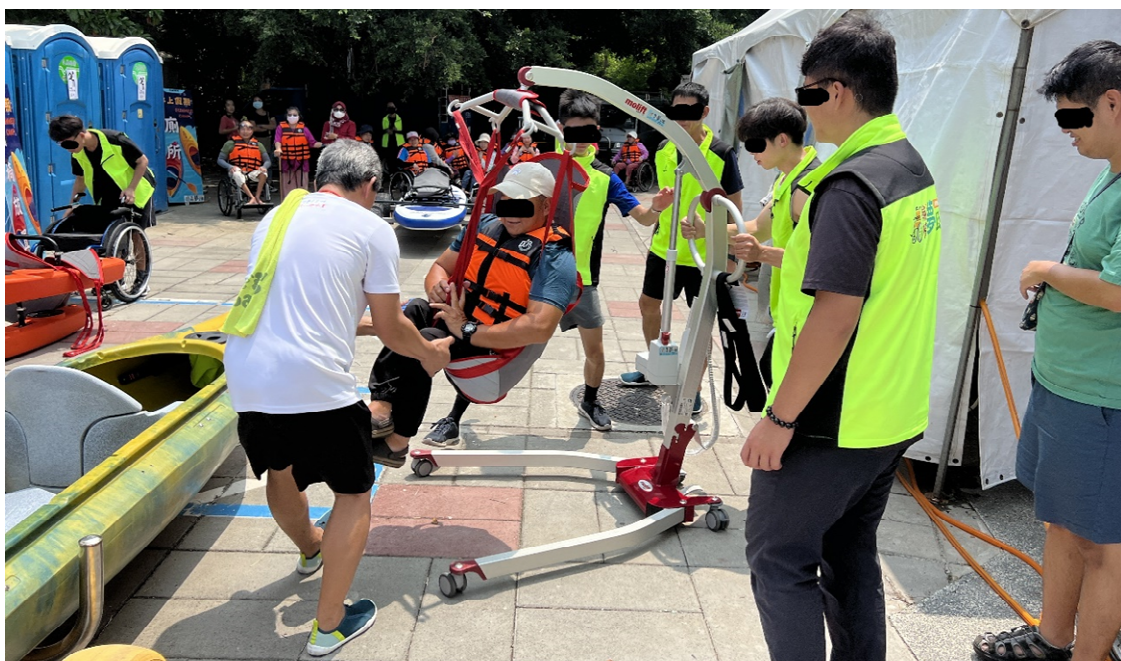
圖 1. 人體吊機範例