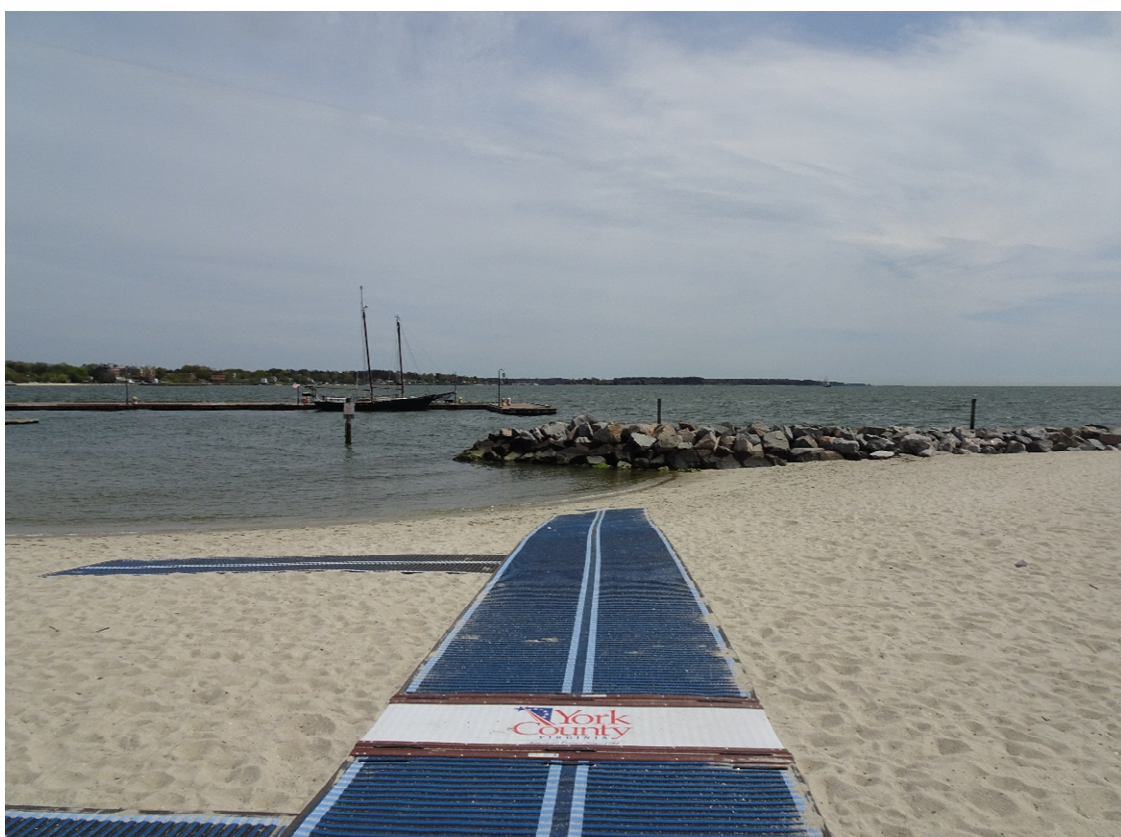
圖 2. 暫時性無障礙海灘墊