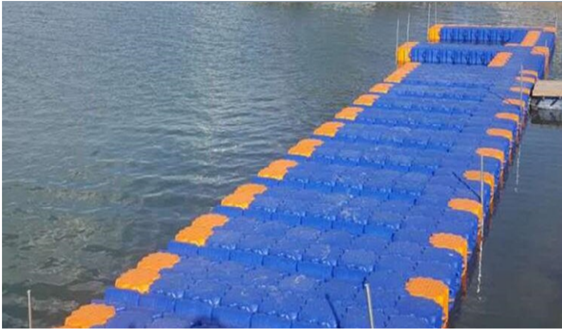
圖 3. 浮動碼頭示意圖