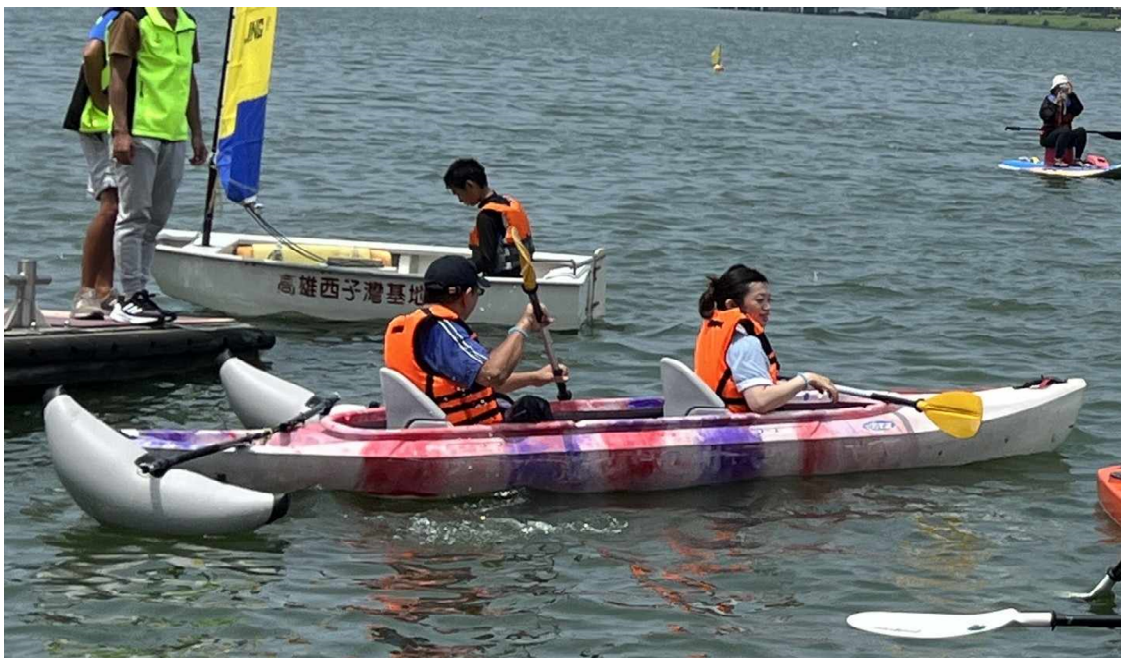
圖 4. 無障礙改裝之獨木舟範例